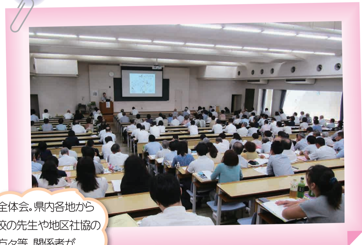
全体会。県内各地から 学校の先生や地区社協の 方々等、関係者が 集まっています。

8月22日(水)、淑徳大学を会場に、実践発表をとおして、学校と地域が協働して福祉教育を推進する意義や効果について考えを深めることを目的とした「千葉県福祉教育研究大会」が開催されました。