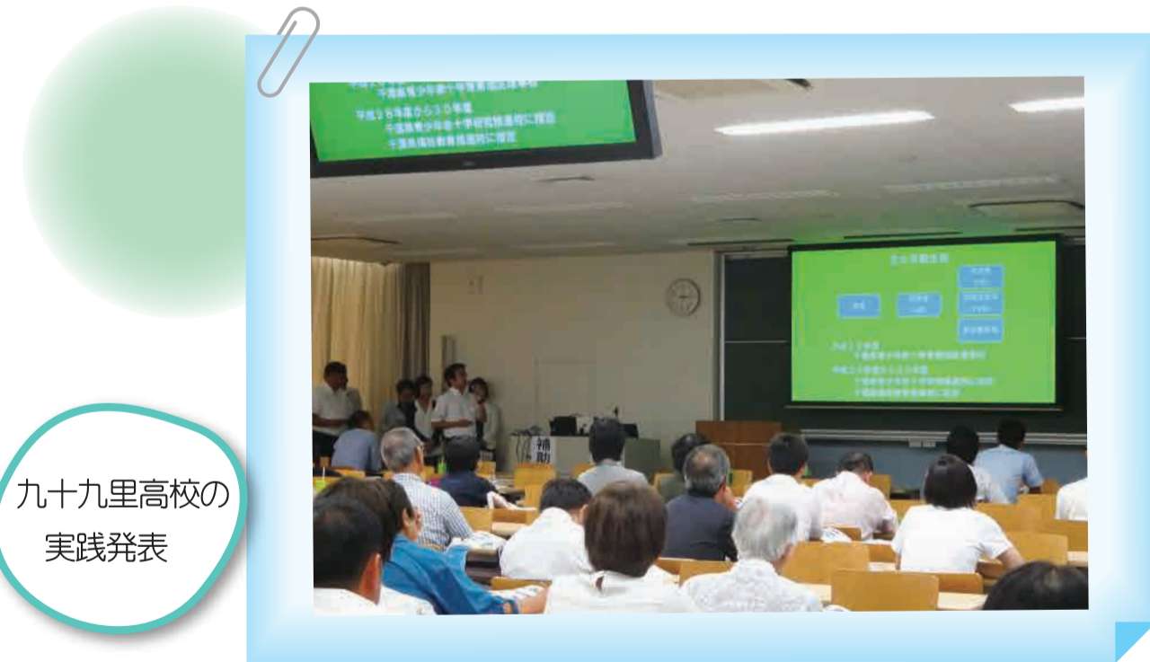
九十九里高校の 実践発表

「協働実践」をテーマに、各学校と地区社会福祉協議会(地域)との連携の方法、各学校や地区社会福祉協議会との連携事業である「ふれあいお楽しみ会」と、各学校で行う「ジョイントコンサート」、「朝のあいさつ運動」や、地区社会福祉協議会で実施している「ふれあいグラウンドゴルフ」など、それぞれの実践を通じて、子ども達がどのように変わったのか?実践の効果と苦労した点を発表し、参加者と情報を共有することができました。