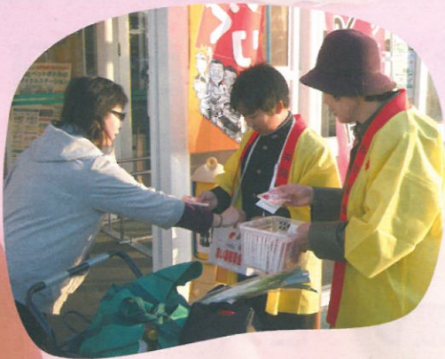
★ 九十九里中学校の生徒の皆さん ★