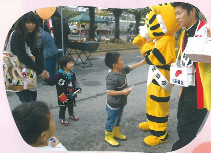
★ 九十九里高校の生徒の皆さん ★