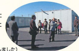
(仮設住宅を視察しました)

「地域で誰もが安心して暮らせる街づくり」を目指し、九十九里町社会福祉協議会の役職員が災害時にどのような支援をするのが適切なのかを身につけるために、県内で大きな被害を受けた旭市社会福祉協議会を昨年11月13日に視察しました。参加した役員さんは、災害ボランティアセンターについての知識が身につく大変参考になり、津波の恐ろしさを再確認できた等の声があり充実した研修会となりました。