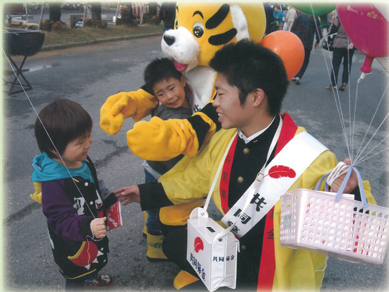
「九十九里高校生による街頭募金にて」