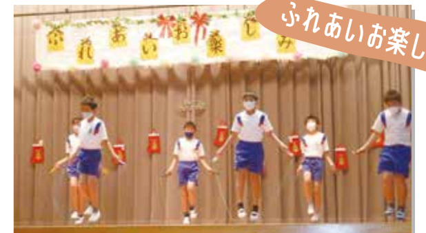
ふれあいお楽しみ会