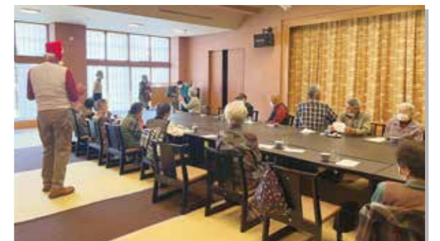
久しぶりのカラオケです（片貝地区）