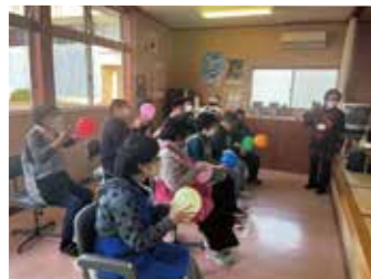
上手くりズムに乗れるかな？

町ダイヤモンドクラブでは、健康増進にと、運動・文化活動を実施しています。 詳しくは町ダイヤモンドクラブ事務局に相談ください。 問い合わせ ダイヤモンドクラブ Tel. 70-3010