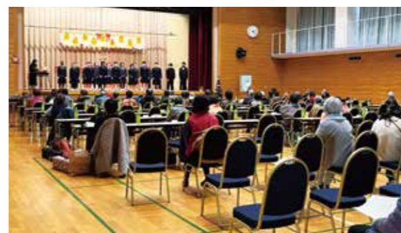
素敵な合唱にうっとり（豊海地区）