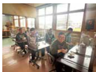
みんなで食べるとおいしいね