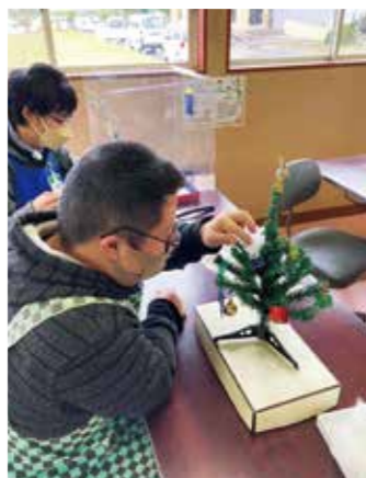
かっこいいツリーの完成！