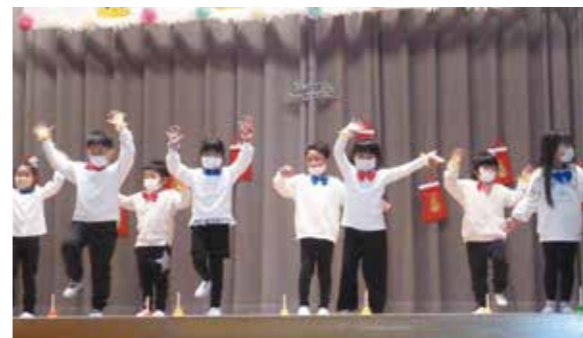
かわいいダンスに癒されます（豊海地区）