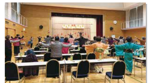
全員でラジオ体操！（豊海地区）