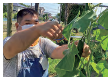
立派なきゅうりが採れました