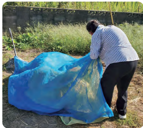
ゴミを捨てる様子