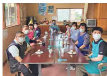
お誕生日おめでとう～!