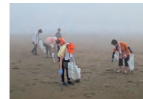
きれいな海岸を目指して