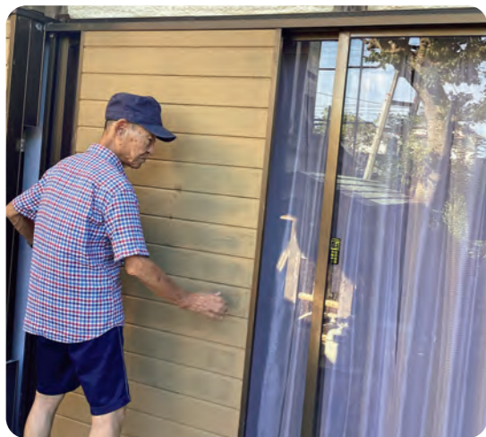
雨戸を閉める様子

「何か地域のためになることをやってみたい！」「あまり時間はとれないけれど朝か夕方の30分くらいなら活動できそう！」「誰かのために少しでも力になれば・・・」どんなきっかけでも構いません。興味のある方は町社会福祉協議会までご連絡ください！！