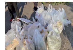
きどうみちも綺麗になりました